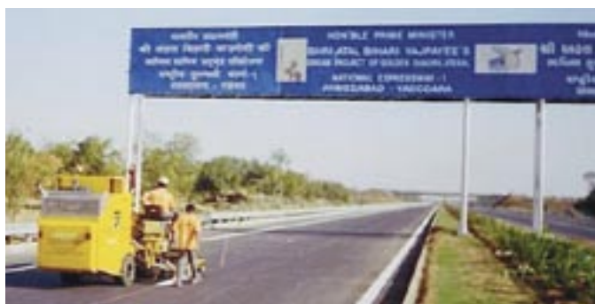
Mark-O-Line Traffic Controls au travail en Inde