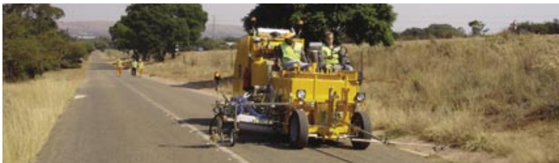
Entrenamiento sobre el terreno de uno de nuestros clientes en Sudáfrica, que acaba de recibir su máquina Borum BM SP T 500-2